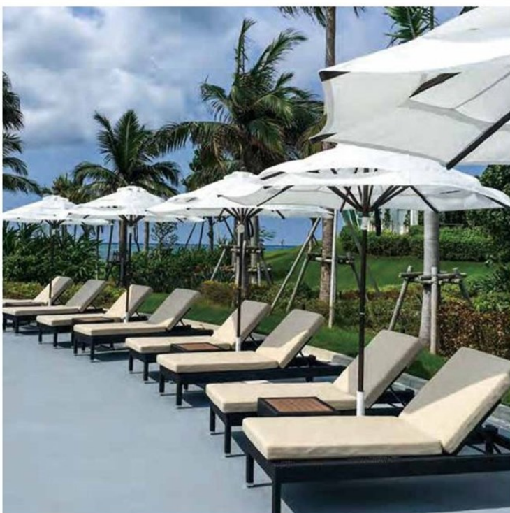
M.U. : SY-2500 ブラウンフレーム 耐風タイプ

木目調フレーム(転写プリント) 焼き付け塗装後、木目模様のフィルムを熱転写し、 本物の木と見間違えう程に仕上げてあります。