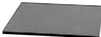
4. インダストリアル 700×700 900×900