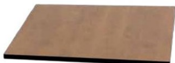
3. ピーチパイン 700×700 900×900