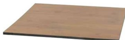
2. パイン(限定品) 700×700 900×900