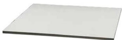
1. ホワイト(限定品) 700×700 900×900