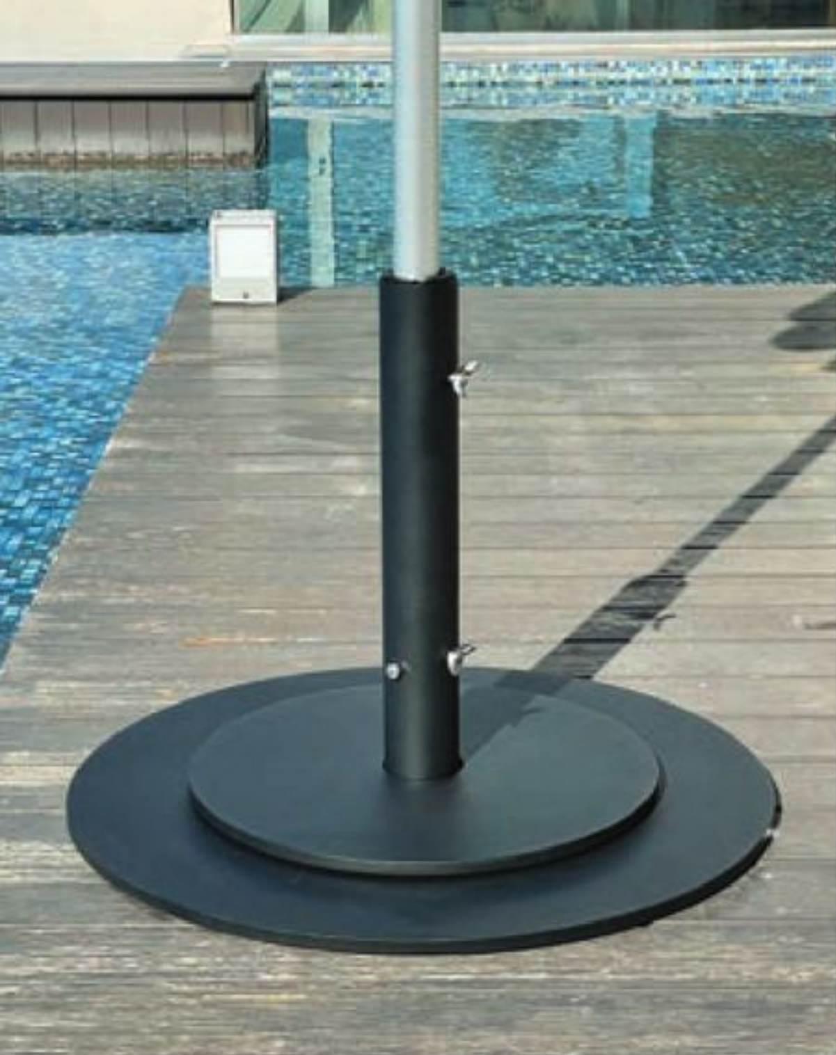
RB40L (RB30L + RBW-10)