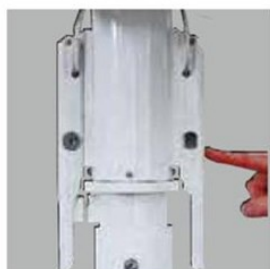
ロックキーを外します。

左右ロックのハンドルを解除し手動にて開閉する方式です。滑らかな軽いタッチで速やかに開閉でき、故障の少ない構造です。