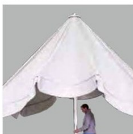
パラソルが開くまで スポークを持ち上げます。