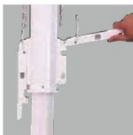
左右のフックをステンレス棒 切り欠きに引っ掛け、ハンドルを 押し下げます。※2段階行います。