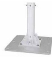
コンクリートアンカーベース Surface Mount