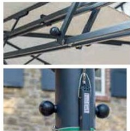
両手で2箇所の球状のツマミを持ち、前方に押し上げます。