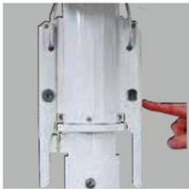
ロックキーを外します。

左右ロックのハンドルを解除し手動にて開閉する方式です。滑らかな軽いタッチで速やかに開閉でき、故障の少ない構造です。