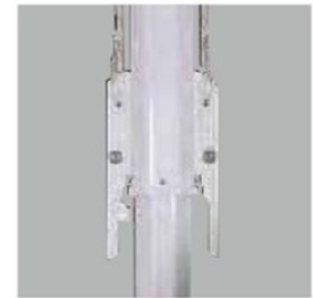
ロックキーを取り付けます。