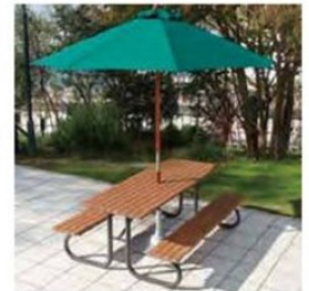
(別売) M.U. : 参考品 / ベース : 参考品