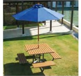
(別売) M.U. : 参考品 / ベース : 参考品

※対応ベースはRB20(500φ)+RB10Wを基本ベースとしてご使用ください。