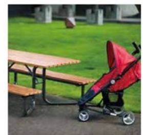
ベビーカー、車椅子対応モデル