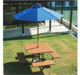
(別売) M.U. : 参考品 / ベース : 参考品

※対応ベースはRB20(500φ)+RB10Wを基本ベースとしてご使用ください。