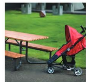
ベビーカー、車椅子対応モデル