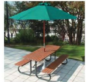
(別売) M.U. : 参考品 / ベース : 参考品