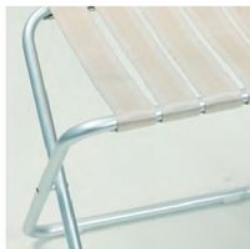
アルマイトシルバー